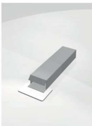
4) Togliere biadesivo, e raddrizzare