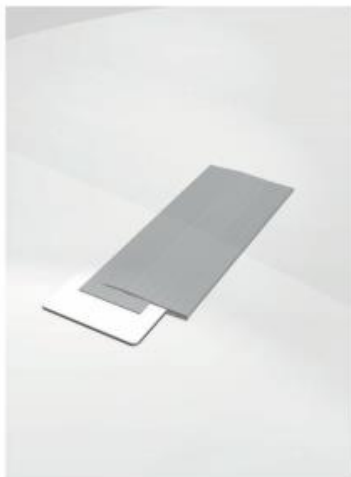
1) prendere base e gonna