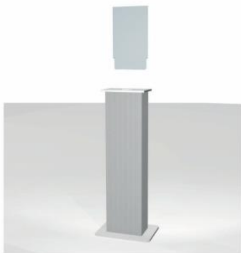
6) Inserire Il Plexiglass nella fessura