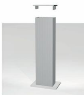
6) Inserire il Top