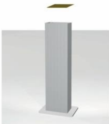
5) Inserire cartone sopra le croci